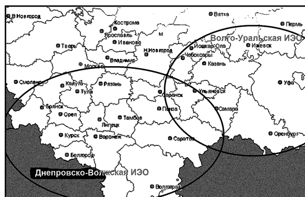
Картосхема 2. Волго-Уральская и Днепровско-Волжская историко-этнографические области

Цивилизационные параллели мордовской песенности с русской музыкально-поэтической системой хорошо известны. Они рассматривались в трудах многих этномусиковедов. Обобщая,