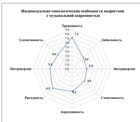
Рис. 2. Соотношение индивидуально-типологических особенностей у подростков с музыкальным типом одарённости

Рассмотрим профиль индивидуально-типологических особенностей подростков, представленный на рис. 2.